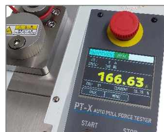
Display mit Touchscreen