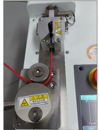
Feste Fixierung der Probe auf Crimp- und Kabelseite