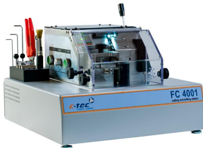
Fine Cutter FC 4001

Feintrennmaschine für große Crimpkontakte