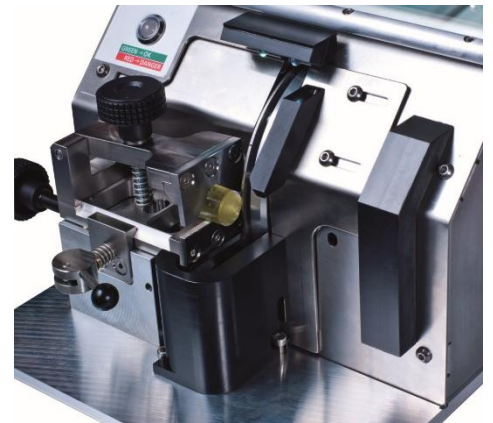
Optional mit Frässscheibe für eingegossene Proben